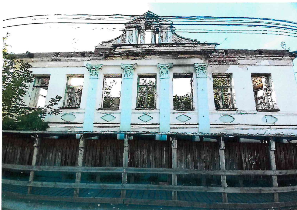
Фото 1. Вид со стороны главного (юго-восточного) фасада