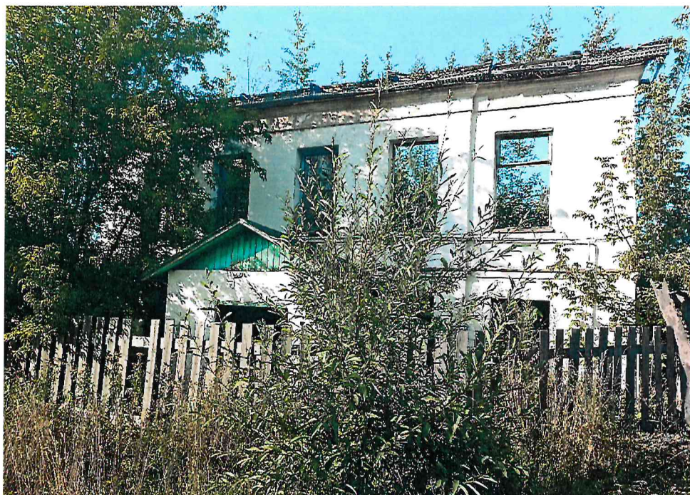
Фото 2. Вид со стороны бокового (юго-западного) фасада