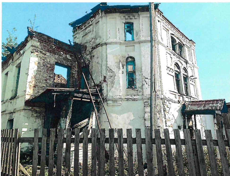
Фото 5. Вид с восточной стороны