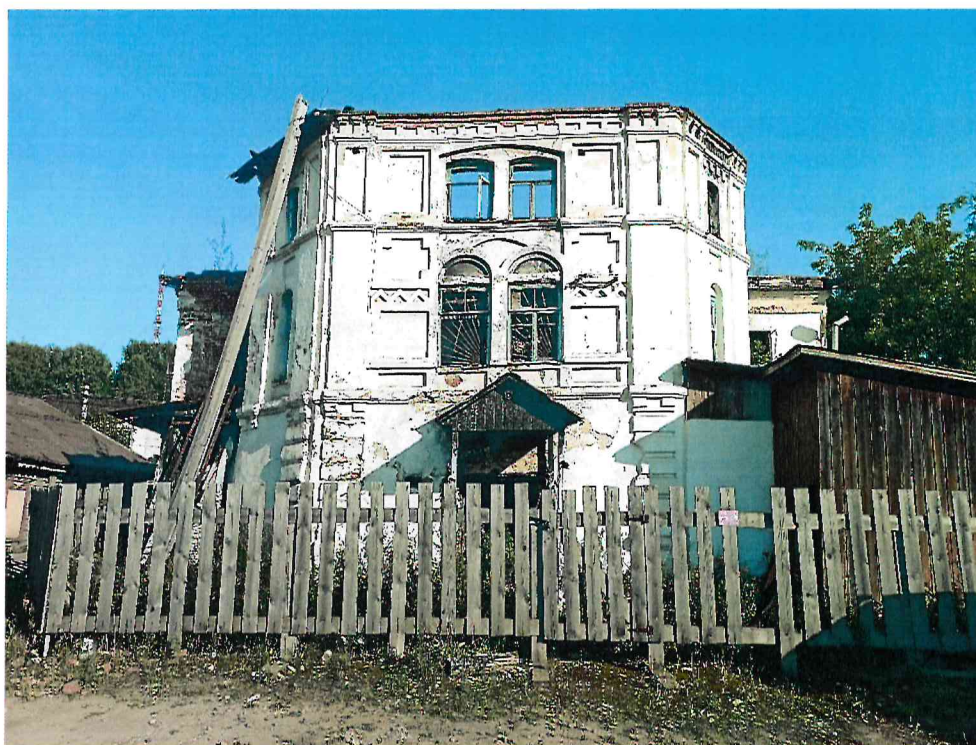
Фото 3. Вид со стороны дворового (северо-западного) фасада